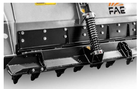
ใบมีดระบบสปริง