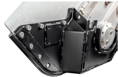
ติดโซ่ป้องกัน