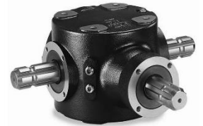
กระปุกเกียร์พร้อมล้อฟรี