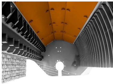
แผ่นป้องกันการสึกหรอด้านในแบบ เปลี่ยนได้ใน Hardox®