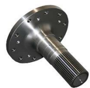
เพลารอเตอร์แบบโบลท์ออน (ในเหล็กหลอม)