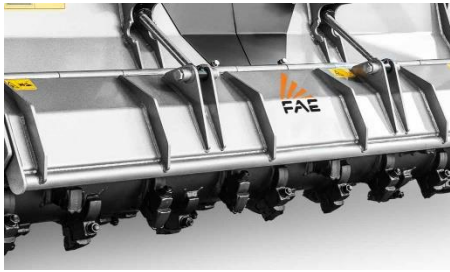
ฝากระโปรงหลังไฮดรอลิก