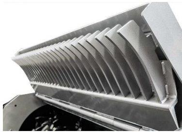
ตะแกรงเหล็กฉีกที่ฝากระโปรงหลัง