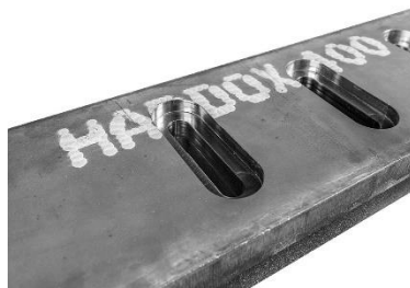
ใบมีด Hardox® แบบปรับได้