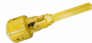
เพลาส่งกำลังพร้อมลูก เบี้ยวคัลซ์